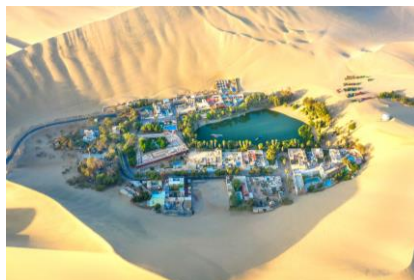
FULL DAY PARACAS - HUACACHINA