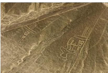
SOBREVUELO DE NAZCA