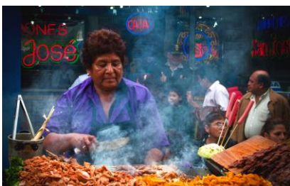
LIMA DOWNTOWN FOOD WALKING TOUR