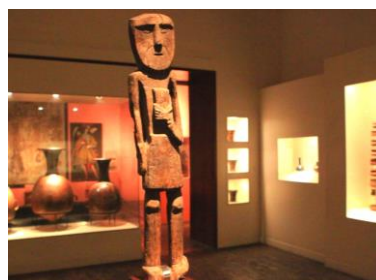
LIMA CITY TOUR & MUSEO LARCO