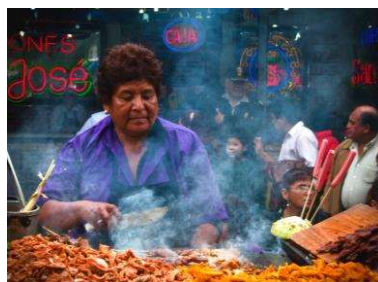
LIMA DOWNTOWN FOOD WALKING TOUR