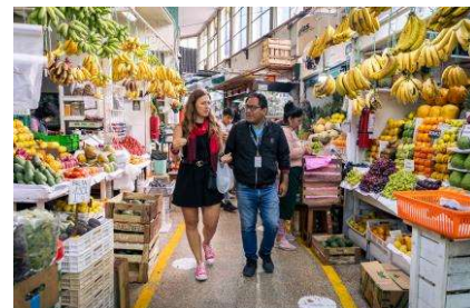
MIRAFLORES FOOD WALKING TOUR