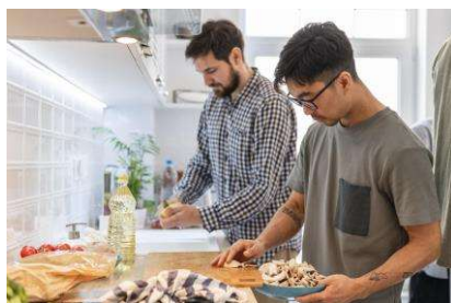
PISCO, CEVICHE Y MÚSICA